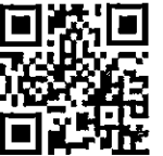
สแกนแผนที่

รถประจำทางที่ผ่านหน้าโรงพยาบาลรามามา รถเมล์ผ่าน สาย 44, 67 รถเมล์ปรับอากาศพิเศษผ่าน สาย ปอ.44